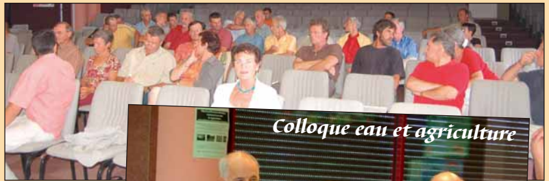
Colloque eau et agriculture

En 2005, EHLG a réalisé un important travail sur le projet 2x2 voies et s'est positionné contre