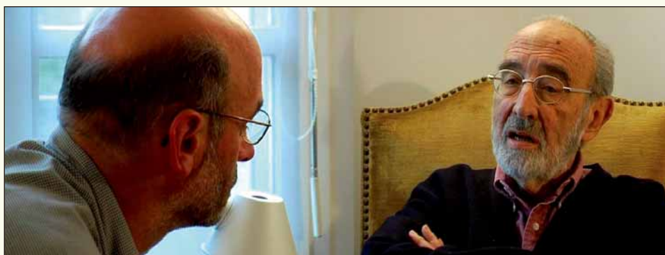
Rencontre le 2/10 entre Michel Berhocoirigoin et Edgar Pisani ancien ministre de l'agriculture et parrain de Lurrama 2006