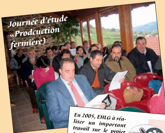
Journée d'étude «Production fermière»