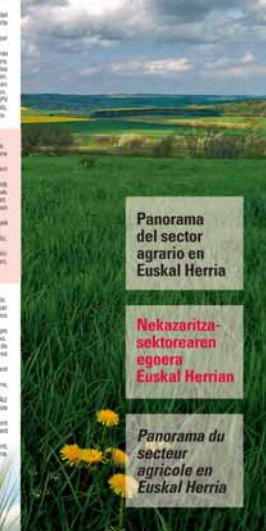
Panorama del sector en Euskal Herria Nekazaritza-sektorearen egoera Euskal Herrian Panorama du secteur agricole en Euskal Herria

Relevés: 1. L'Etat, à partir de ses missions confiées, se caractérise par un rôle de soutien. 2. Les collectivités de l'Etat (Etat, Région) se caractérisent par un rôle de soutien. 3. Le rôle de l'Etat (Etat, Région) se caractérise par un rôle de soutien. 4. Le rôle de l'Etat (Etat, Région) se caractérise par un rôle de soutien. 5. Le rôle de l'Etat (Etat, Région) se caractérise par un rôle de soutien. 6. Le rôle de l'Etat (Etat, Région) se caractérise par un rôle de soutien. 7. Le rôle de l'Etat (Etat, Région) se caractérise par un rôle de soutien. 8. Le rôle de l'Etat (Etat, Région) se caractérise par un rôle de soutien. 9. Le rôle de l'Etat (Etat, Région) se caractérise par un rôle de soutien. 10. Le rôle de l'Etat (Etat, Région) se caractérise par un rôle de soutien.