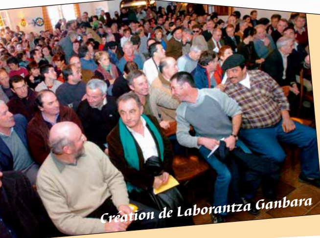
Création de Laborantzak Ganbarara

que élus signataires ici dans les industries Basque intérieur, et ocaux. la désertification qui un élément fondateur de bruses familles et de meilleur vecteur de , en particulier la baisse du tations sans suite, sont un milieu rural vivant, d'accueil de mille nouveaux agricoles de l'intérieur très des décideurs beaucoup de élevant notre agriculture. sion du besoin d'une structure présentants missionnés par le de fausses avancées sur le ité avec les 26 communes ion votée par les Conseils za Ganbarara, et nous étonnons : œuvre compte tenu des montants. veloppement local, e d'égalité avec des arguments un véritable outil de développement les spécificités et les besoins du ser travailler l'association et de lever ion du premier anniversaire de sa Ganbarara, structure qui répond à une