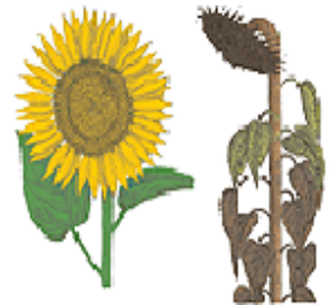
Helianthus annuus (Asteracea)

Le tournesol est une culture de printemps qui demande peu de travail. Sa rusticité le rend résistant à la sécheresse. Il s'accommode de tout type de sol dont les sols pauvres. Les sols trop fertiles ou trop humides lui sont défavorables car ils le fragilisent.