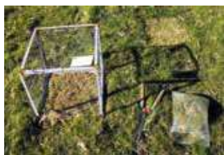
Eremu bat babesteko kaiola, bazka-ekoizpena segitzeko instalatua dena. Datu kualitatiboak eta kuantitatiboak lortzeko ahal emaitzen dute.

gun, hein handi batean ez dira gehiago baliatuak.