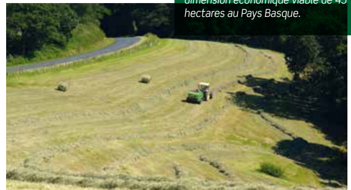
Au moment de l'installation, comme de tout agrandissement, de changement de surface ou de siège social, une demande d'autorisation d'exploiter peut devenir nécessaire.

Contrairement à l'idée reçue, les JA ne sont pas les seuls propriétaires, il y a aussi les paysannes et paysans évincés par expropriation ou leur bailleur, et ceux qui agrandissent leur exploitation dans la limite de la surface permettant d'atteindre la dimension économique viable de 45 hectares au Pays Basque.