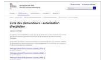
Les demandes d'autorisation d'exploiter sont publiées régulièrement sur le site de la Préfecture des Pyrénées-Atlantiques.

En cas de candidature concurrente, le délai d'obtention d'une autorisation atteint plus de 6 mois contre 4 mois, sans concurrence. Comme on ne peut savoir à l'avance s'il y aura concurrence, il est indispensable qu'un propriétaire cédant identifie son repreneur assez tôt, afin que ce dernier dépose, le cas échéant, une demande d'autorisation au moins 6 mois avant la reprise.