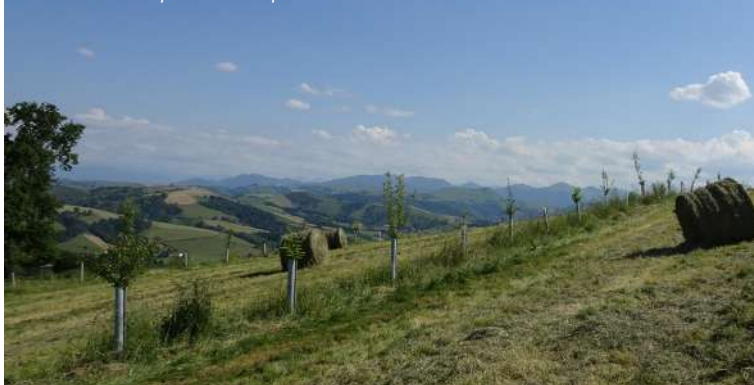
Photo prise en juin 2020 d'une plantation en agroforesterie intraparcellaire réalisée à l'hiver 2018-2019 sur une ferme d'élevage en ovin viande d'Uhart-Mixe. Objectif premier : apporter de l'ombrage aux animaux sur ces parcelles très exposées.

Les filières végétales ne sont pas en reste. Des projets sont en cours en maraîchage et viticulture.