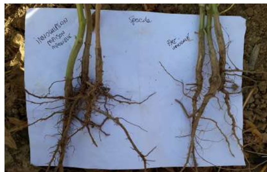
À gauche : inoculation "maison" bien réussie, nodosités présentes À droite : Semence non inoculée, pas de nodosité

En 2020, un essai sur une parcelle d'Arbouet a été réalisé avec la variété Speeda afin de comparer les effets de l'inoculation.