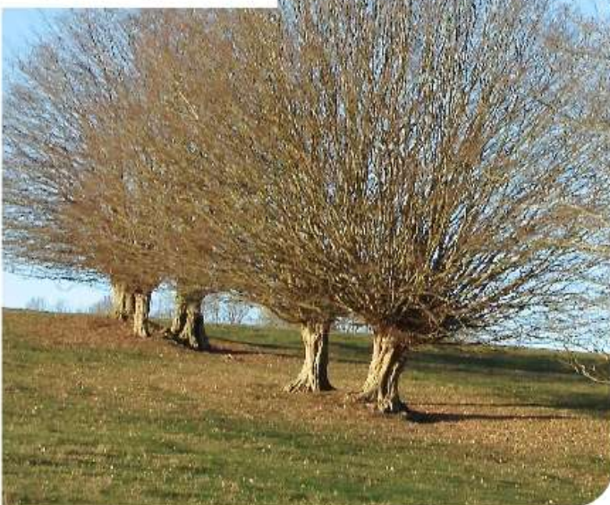
Trogne taillis perché

Son seul véritable inconvénient : la nécessité d'intervenir à hauteur. Mais on peut aussi faire des trognes basses !