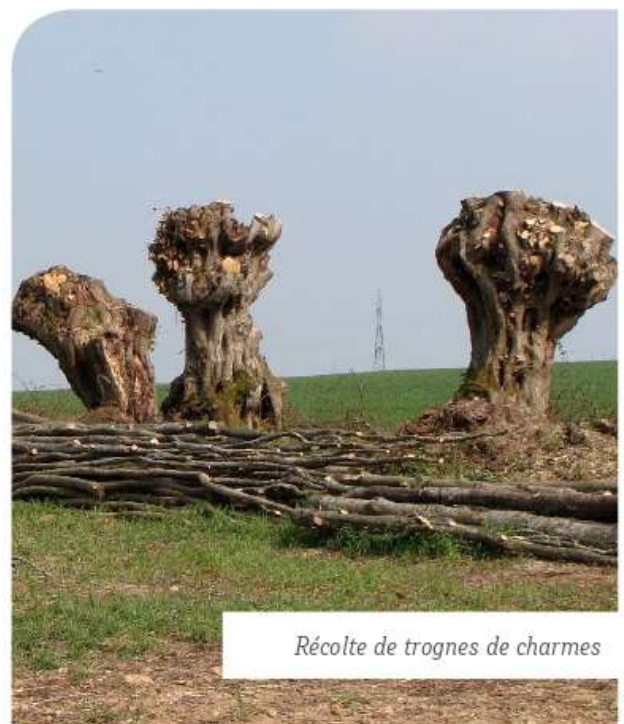
Récolte de trognes de charmes