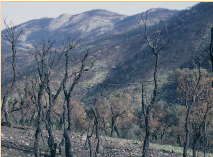
Photo. 1/ Forêt de chênes-lièges incendiée dans le massif des Maures en août 2003. Col du Bougnon, cliché pris le 27 décembre 2003.

«L'année 2003, en France, restera dans les mémoires comme l'une des plus dramatiques sur le plan des incendies de forêt». C'est par cette phrase que commence le bilan des feux de forêt dans le Sud-Ouest de l'Europe en 2003, publié dans la revue Rendez-vous technique de l'ONF (Gilbert, 2004, p. 18). Tout en comprenant l'émoi suscité par les images de désolation qu'inspirent les forêts en flammes ou les bois carbonisés (photo 1), on ne peut être que surpris par la dramatisation faite de ce bilan, rédigé par un responsable de la sous-direction des forêts au ministère de l'Agriculture. Dans une région méditerranéenne périodiquement affectée par les incendies, les feux de 2003 ont-ils été à ce point exceptionnels?