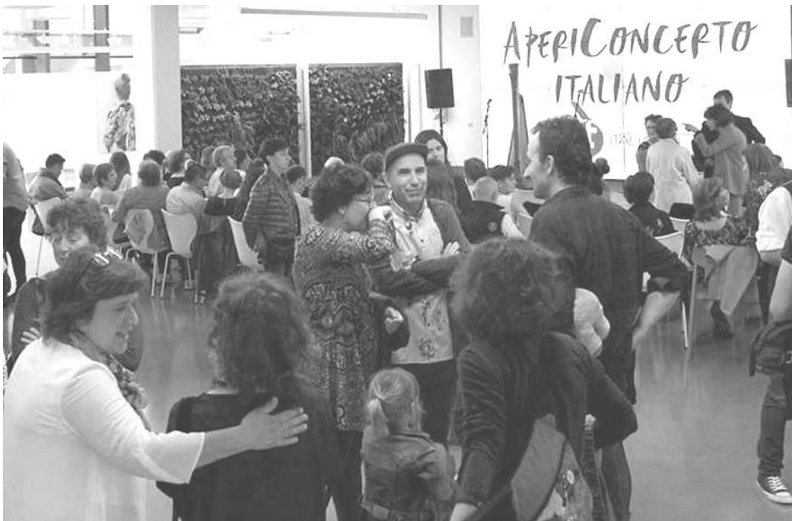
Donostiako Tabakaleran egin zuten Italia Txiki elkartearen aurkezteko aperitifa-kontzertua. HITZA

Lapurdi eta Gipuzkoa artean bizi diren italiarrak biltzea da Italia Txiki elkartearen helburua. Lehen urteurrena beteko du elkarteak udaren bukaeran.