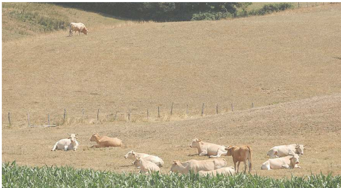
2015eko laborantzako datu ekonomikoak aztertu ditu Euskal Herriko Laborantza Ganberak.

Laborantzaren emaitza gordina jakin dute, adibidez, lan horri esker. Karga estrukturalak kendu gabe –ez baitute elementurik kalkulu hori egiteko–, 123 milioi euro da laborantza sailaren emaitza gordina. Horrekin zenbat jende bizi den behaturik agertu zaie Ipar Euskal Herrian, Frantziako Estatuari konparatuz,